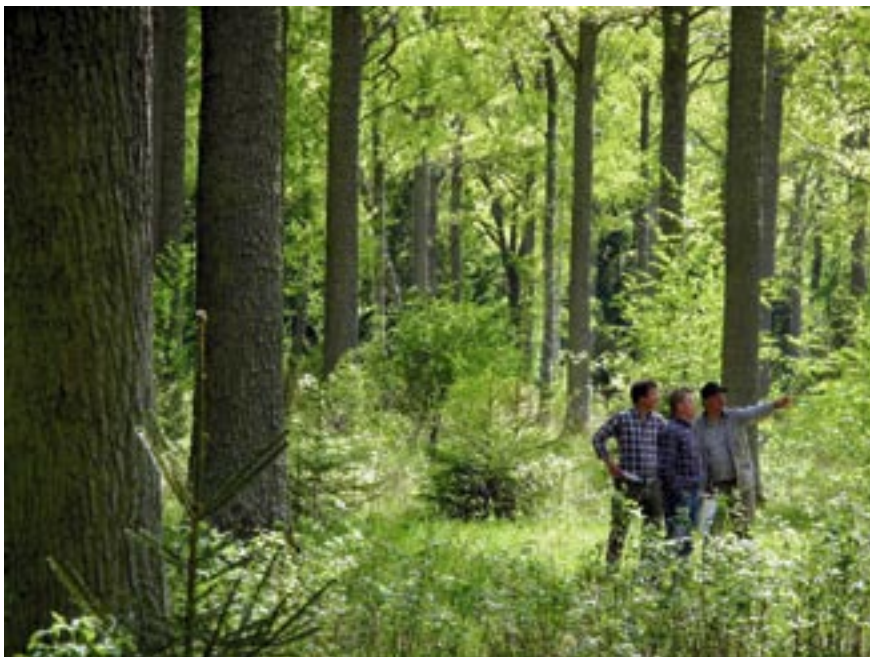
På Visingsö kan vi vandra i Sveriges största sammanhängande ekskog.